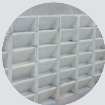
ECOBLOCO SM01 (12,5 blocos/m²)

Após a secagem completa (pelo menos 2 horas), pode-se iniciar a montagem dos blocos, segundo as referências abaixo: